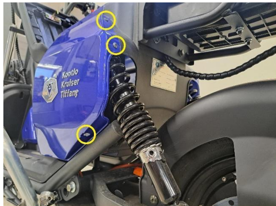
Irrota istuimen vasemmanpuoleisen alasivumuovin kiinnitysruuvit (ristipäämeisseli ph2).